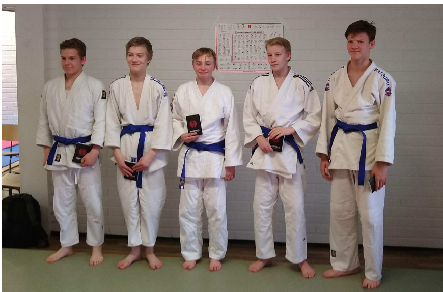
Uudet sineiset vyöt graduoinnin jälkeen

Verrattuna vuoteen 2018 korkeampia voitã suoritettiin huomattavasti enemmän. Usein harrastajien kehityskäyrã menee siten, että joka toinen vuosi suoritetaan enemmän korkeampia voitã ja joka toinen alempia voitã. Myös keltaisia voitã suoritettiin mukavasti 23.