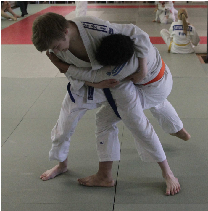
Sali kisoissa ottelemista

Juniorit jaettiin kokonsa puolesta ryhmiin ja he ottelivat sarjansa, niin että jokaisesta sarjasta selvisivät kolme parasta. Tämän jälkeen tarjolla oli ulkona grillattua makkaraa, limua ja karkkia.