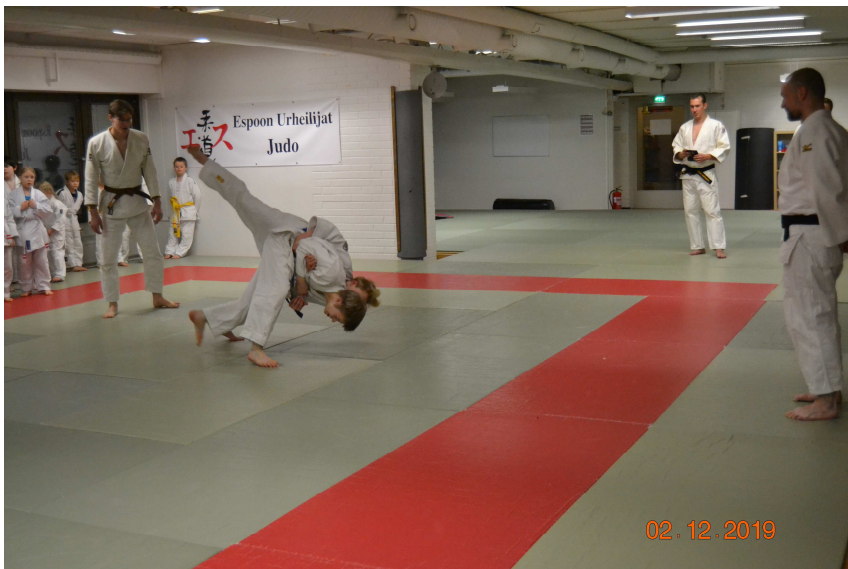
Nuoremmat harrastajat näyttävät taitojaan